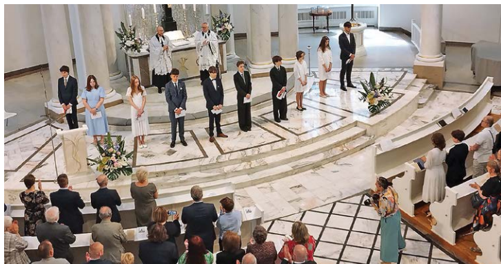
15.06.2025 r., konfirmacja