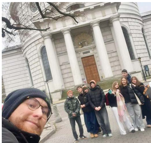
Grudzień 2025 r., zjazd konfirmantów