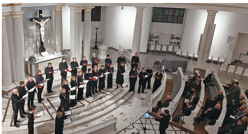
5.10.2025 r., koncert Kammerchor der Berliner Domkantorei