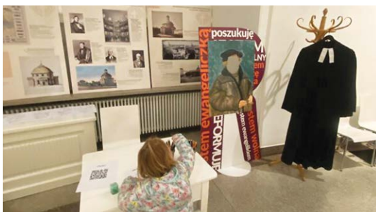
17.05.2025 r., Noc Muzeów