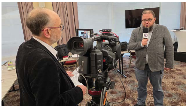
Studio Lutheraneum podczas nagrywania

Wspólnie z Amacom.TV utrwalamy wspomnienia w cyklu „Moja historia...”, a także transmitujemy debaty z cyklu „Rozmowy pod kopułą: Europa – Kościół – Ekumenia”.