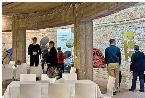
5.11.2025 r., Wystawa z okazji 90 lecia Towarzystwa im. Fryderyka Chopina