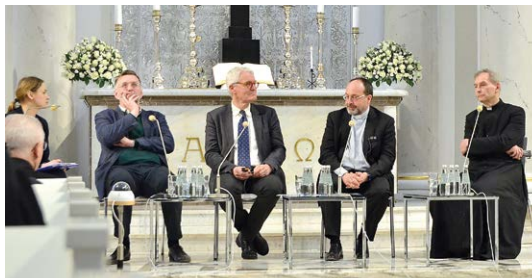
6.04.2025 r., Europa-Kościół – Ekumenia w dobie rozchwiania. Rozmowy pod kopułą