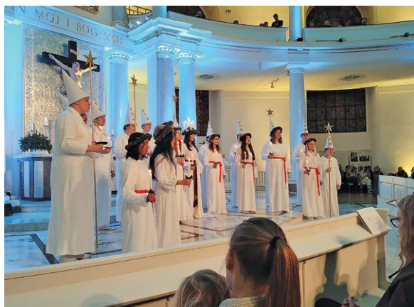
4.12.2025 r., koncert z okazji Dnia Świętej Łucji