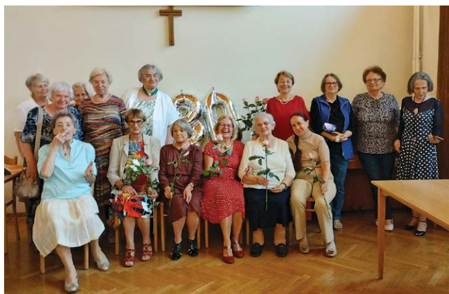
Grupa pań i seniorów Parafii Świętej Trójcy