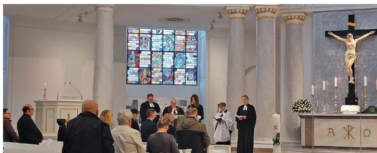
5.10. 2025 r., Polsko-niemieckie nabożeństwo o pokój