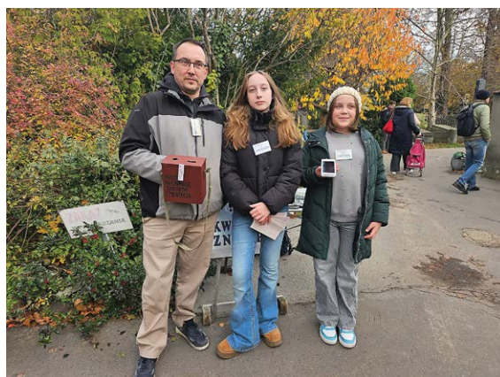
1.11.2025 r., kwesta na cmentarzu