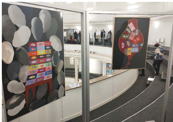
7.12.2025 r., fragment wystawy