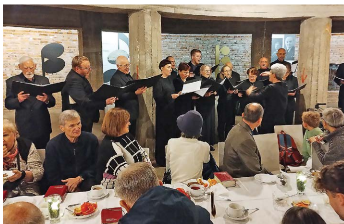
21.12.2025 r., adwentówka parafialna