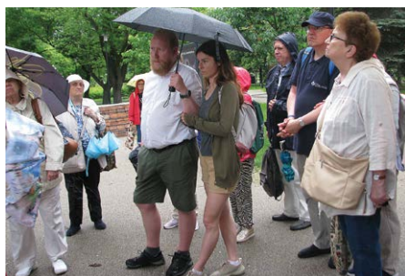
7.06.2025 r., wycieczka parafialna do Łodzi