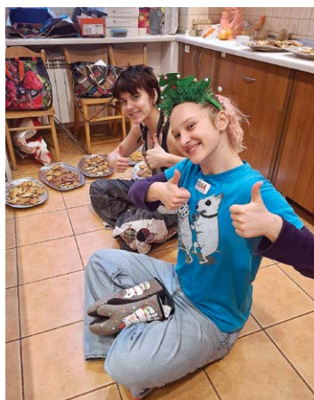
13.12.2025 r., pieczenie pierniczków