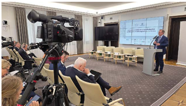
Nagrywanie dyskusji w senacie

Jak co roku gościliśmy z kamerą na terenie placówek edukacyjnych Ewangelickiego Towarzystwa Oświatowego przy okazji Świątecznego Kiermaszu Charytatywnego oraz relacjonowaliśmy Świąteczny Koncert z naszego kościoła. Podczas Warszawskiej Nocy Muzeów Studio zorganizowało projekcje filmu „Historia luteranizmu w Polsce”.