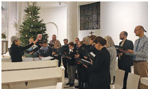
12.01.2025 r., koncert kołed