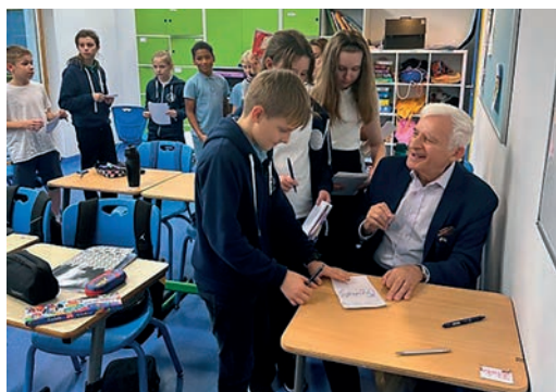
Wizyta prof. Jerzego Buzka w szkole

W dniu Święta Reformacji rozmawialiśmy z przedszkolakami o osobach, które zmieniły świat lub wywarły duży wpływ na bieg historii (Alessandro Volta, Tomasz Edison, Mikołaj Kopernik, Fryderyk Chopin, Stephen Hawking, Marcin Luter). Był to punkt wyjścia do rozmowy o tym, że dzieci również mogą zmieniać świat – globalnie i wokół siebie, teraz i w przyszłości.