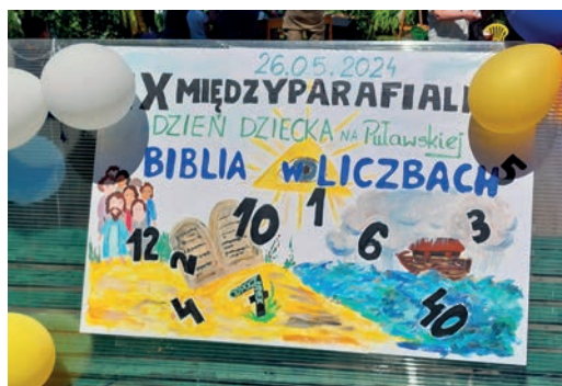
Międzyparafialny Dzień Dziecka