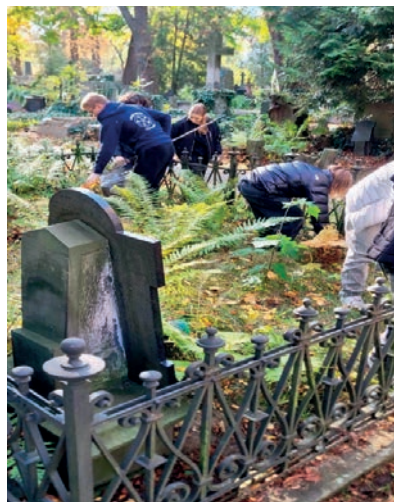
Sprzątanie Cmentarza przez uczniów-wolontariuszy