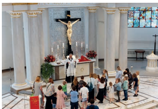
Szkółka i przedszkole niedzielne