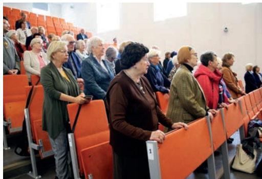
Słuchacze EUTW podczas uroczystej inauguracji roku akademickiego.

Inauguracja roku akademickiego 2024/2025 odbyła się 15 października 2024 r. w Chrześcijańskiej Akademii Teologicznej w Warszawie przy ul. Broniewskiego 48. Wykład inauguracyjny pt. „Irenizm pedagogiczny. Od wiedzy do powinności” wygłosił ks. prof. dr hab. Bogusław Milerski.