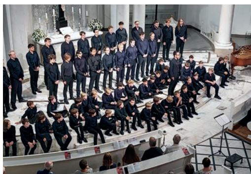
Koncert Staats- und Domchor Berlin (30.08.2024)