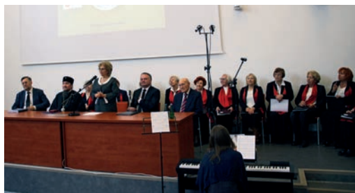
Uroczysta inauguracja roku akademickiego.

Sprawa finansowania naszej działalności statutowej wymaga szczególnej uwagi i kreatywności. Same składki członkowskie w wysokości 150 zł rocznie nie wystarczają na sfinansowanie projektu, ale występujemy o dofinansowanie do władz rządowych i samorządowych. W 2024 r. otrzymaliśmy dotację jedynie z Urzędu m. st. Warszawy. Korzystamy z trzyletniego programu publicznego w zakresie działalności na rzecz osób w wieku emerytalnym. Przed nami następne wyzwanie: ubieganie się o dotację z nowej trzyletniej edycji konkursu.