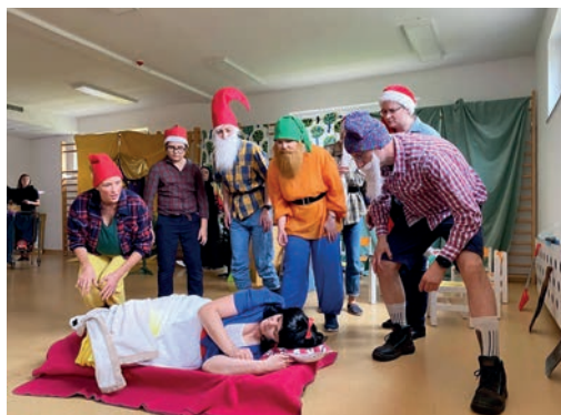
„Królowa Śnieżka” – przedstawienie rodziców

Maj i czerwiec obfitował w wiele wydarzeń: ogólnopolska akcja „Rowerowy Maj” w Szkole, egzamin i bal ósmoklasisty, przedszkolny projekt „Rowerowy Czerwiec”, Dzień Dziecka – z jego okazji rodzice z Przedszkola przygotowali przedstawienie-niespodziankę pt. „Królowa Śnieżka”. Odbyły się również wyjazdy na zielone szkoły.