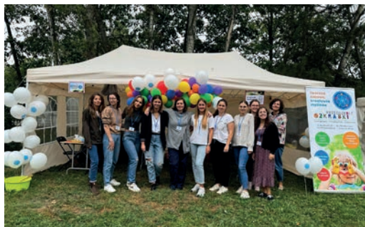
13. Piknik „Odczarowanie Hospicjum”

W 2024 r. uroczyste rozpoczęcie roku szkolnego 2024/2025 odbyło się 2 września. Był to wyjątkowy dzień dla Szkoły. Z okazji 10-lecia, dzięki zaangażowaniu Zarządu Fundacji, zmodernizowaliśmy boisko do piłki nożnej. Była to niesamowita niespodzianka dla naszej społeczności, przyjęta hucznymi brawami. Każda z klas otrzymała także piłkę do wspólnego grania. Boisko jest używane zarówno na lekcjach wychowania fizycznego, jak i na przerwach obiadowych, kiedy uczniowie mają czas na odpoczynek, a także popołudniami w ramach zajęć świetlicowych. Wyremontowane boisko bardzo uatrakcyjniło naszą infrastrukturę.