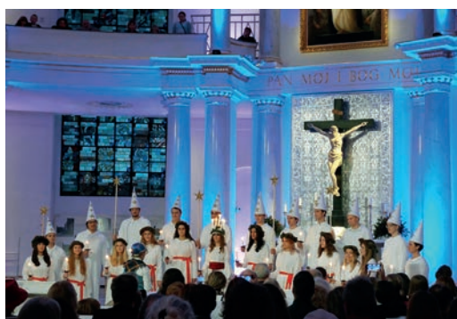
Koncert chóru Young Cathedral Voices z Uppsali (05.12.2024)