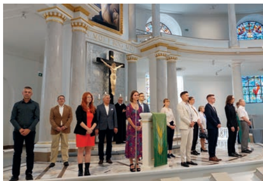
Uroczystość wstąpienia do Kościoła (08.09.2024)