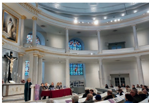
Sprawozdawcze Zgromadzenie Parafialne (25.02.2024)