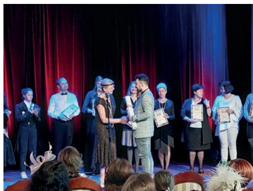
Diecezjalny Zjazd Chórów w Żyrardowie