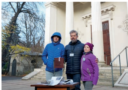
Kwesta na Cmentarzu Ewangelicko-Augsburskim (01.11.2024)