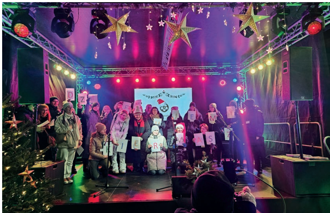
Charytatywny Kiermasz Świąteczny