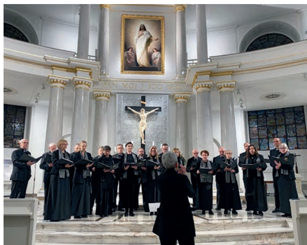
Chór Semper Cantamus