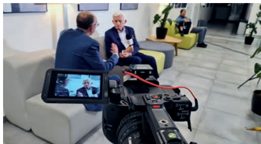
W trakcie wywiadu z prof. Jerzym Buzkiem

We wrześniu wznowiliśmy transmisje wybranych nabożeństw niedzielnych z tłumaczeniem na Polski Język Migowy (PJM). Tłumaczenia dla osób niesłyszących z udziałem lektorki PJM są dostępne w trakcie transmisji nabożeństw w każdą drugą niedzielę miesiąca. Co ciekawe, lektorka PJM łączy się z nami zdalnie aż z Pszczyny i tłumaczy na żywo. W zeszłym roku kontynuowaliśmy też udaną współpracę z zespołem