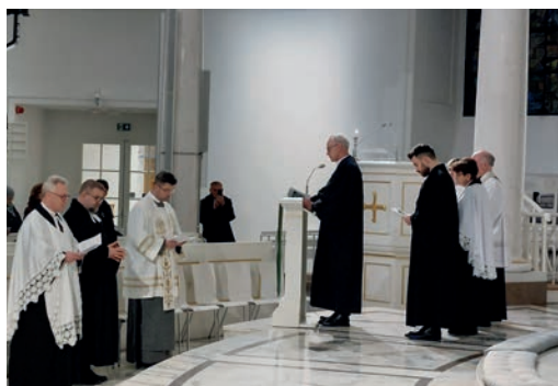
Nabożeństwo w Tygodniu Modlitw o Jedność Chrześcijan (24.01.2024)