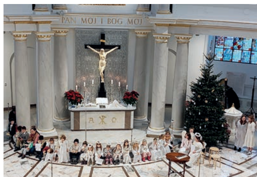
Gwiazdka parafialna (06.01.2024)